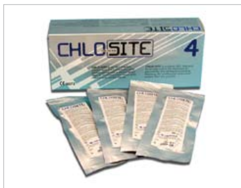
4 pcs x 1,0 ml