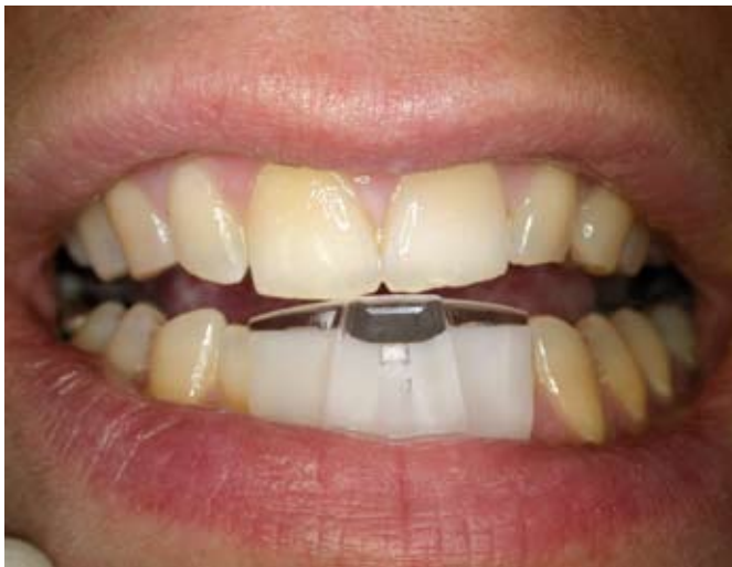
Die NTI-tss im Mund

Das von der amerikanischen FDA bereits im Jahr 1998 zur Prävention und Behandlung von Kiefergelenksbeschwerden, CMD, Bruxismus und zur Prävention von Okklusall-Traumata zugelassene Schienenkon-